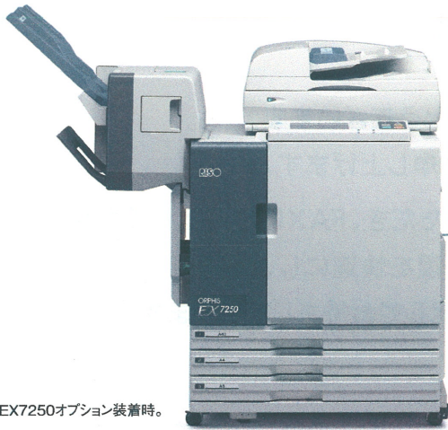
*写真はEX7250オプション装着時。